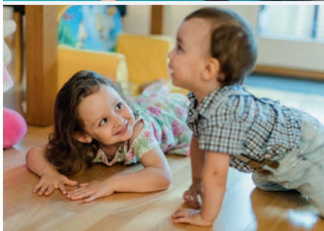
Wichtig für die Familie sind jetzt Zeit füreinander und schöne gemeinsame Momente. Das gibt allen Kraft.